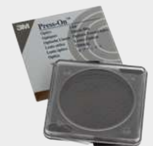
LÁMINA PRISMÁTICA (67 mm) para compensar desviaciones.